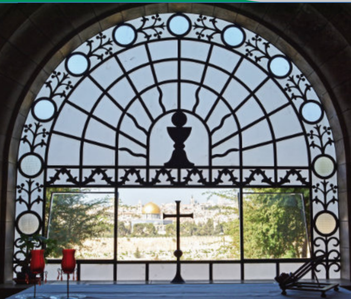
Foto: Blick vom Ölberg aus der kath. Kirche Dominus flevit (der HERR weinte) nach Jerusalem