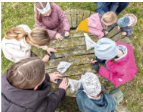
Bilder Seite 20: Legotage im März (oben) Ökumenischer Kreuzweg (Mitte) Jugendnacht am Karsamstag (unten)